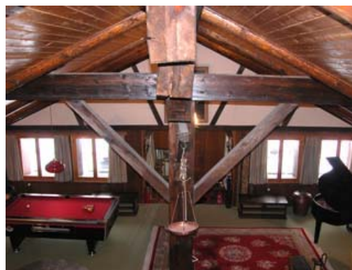
Teilansicht des Wohnzimmers der oberen Etage

Die benachbarten Chalets l'Hermitage, la Bergerie und la Chaumière können, bei Bedarf, im Verbund gemietet werden. Somit finden auch größere Gruppen Platz.