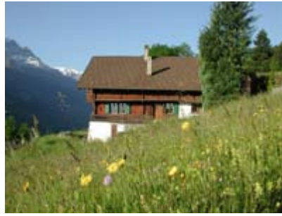
Das Chalet l'Hermitage im Frühling

Das Chalet l'Hermitage ist ein wunderschönes, umgebautes Bauernhaus der Luxusklasse mit einer Wohnfläche von 460 m 2 . Dieses luxuriös-rustikal möblierte Haus bietet Ihnen einen Salon im ersten Stock mit einem Konzertflügel, einem Pool-Billardtisch und einer Satellitenfernsehanlage. Ein weiterer, großräumiger Salon mit offenem Kamin und integriertem Eßzimmer befindet sich im Erdgeschoß. Ferner hat das Chalet vier Schlafzimmer für je zwei Personen, drei Badezimmer, eine Küche mit Eßecke, im Kellergeschoß einen großen Partyraum und eine Sauna.