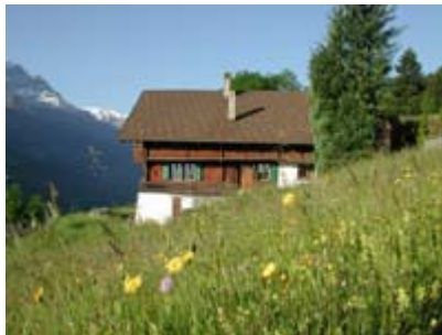
Vue sur la façade latérale du chalet l'Hermitage au printemps

Splendide chalet du 19ème siècle qui offre une surface habitable de 460m 2 . L'étage contient un très vaste salon avec un piano à queue et la télévision satellite. Le salon au rez-de-chaussée dispose d'une cheminée à bois et d'un grand espace qui sert de salle à manger formelle. Ce chalet comporte également 4 chambres à coucher doubles, 3 salles d'eau, une cuisine avec coin à manger, un carnotzet et un sauna. L'agencement est soigné et luxueux.