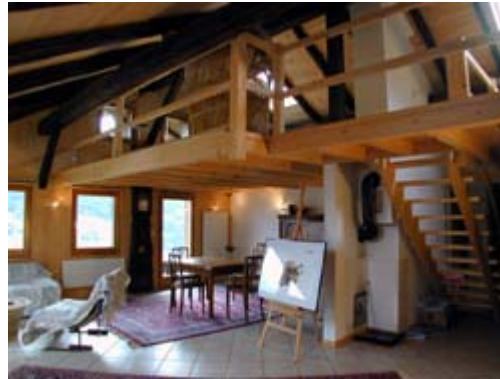
Vue partielle du salon

L'appartement du premier étage du chalet la Chaumière comporte 180m 2 . Il est composé d'un large et lumineux espace ouvert dans lequel se trouvent le coin télévision avec cheminée, la salle à manger et la cuisine. Sur le même niveau se situent une salle de bain complètement agencée, une douche et un toilette séparé, 2 chambres à coucher avec lits doubles et un escalier menant sur un étage en mezzanine. Ce dernier contient une chambre double, un petit salon et un espace jeu doté d'une table de billard américain. Deux terrasses, dont une couverte et un balcon qui offre une splendide vue sur la plaine du Rhône et les alpes font partie de l'ensemble.