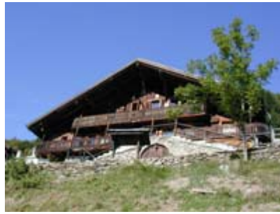
Vue sur la façade du chalet la Chaumière en été

Le Chalet la Chaumière est une magnifique ferme de la fin du 19ème siècle qui a été entièrement rénovée en 1997. Le charme authentique des demeures anciennes y a été scrupuleusement respecté tout en intégrant un équipement moderne. A titre d'exemple, les trois fourneaux en pierre ollaire du 19ème siècle ont été préservés malgré l'installation d'un chauffage central performant.