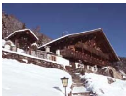
Vue sur la façade du chalet la Chaumière en hiver

Les chalets la Chaumière, la Bergerie et l'Hermitage sont situés à faible distance les uns des autres. Ces unités peuvent être loués conjointement pour accommoder des groupes plus importants.