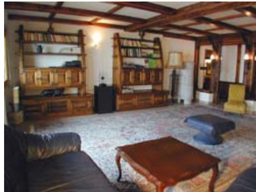
Vue partielle du salon

L'appartement du rez-de-chaussée du chalet la Chaumière s'étale sur 210m 2 . Il comporte 3 chambres à coucher avec lits doubles, 2 salles de bain, une cuisine avec un espace salle à manger, un grand salon avec cheminée, une salle de billard et un magnifique jardin d'hiver. Une belle terrasse est dotée d'un complexe couvert composé d'un barbecue et d'une table pour 10 personnes.