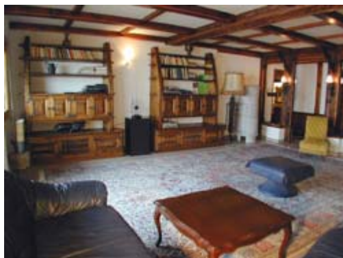
Vue partielle du salon

L'appartement du rez-de-chaussée du chalet la Chaumière s'étale sur 210m 2 . Il comporte 3 chambres à coucher avec lits doubles, 2 salles de bain, une cuisine avec un espace salle à manger, un grand salon avec cheminée, une salle de billard et un magnifique jardin d'hiver. Une belle terrasse est dotée d'un complexe couvert composé d'un barbecue et d'une table pour 10 personnes.