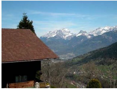
Vue sur la façade latérale du chalet la Bergerie au printemps