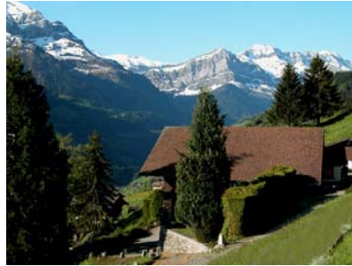
Vue sur la façade latérale du chalet la Bergerie en été

Le chalet la Bergerie est une splendide bâtisse du 19ème siècle qui offre une surface habitable de plus de 350m 2 . Un très vaste salon avec une imposante cheminée ouverte, un équipement stéréo haut de gamme et un piano à queue se situent au premier étage. Le rez-de-chaussée comporte entre autre une chambre de jeux, une très grande de salle à manger, un coin Internet et une cuisine. 5 chambres à coucher doubles et 3 salles d'eau font également partie de l'habitation. L'agencement fabriqué en partie sur mesure est soigné et luxueux. A partir de la saison d'hiver 2010-2011 un sauna avec un local de repos seront également à disposition.